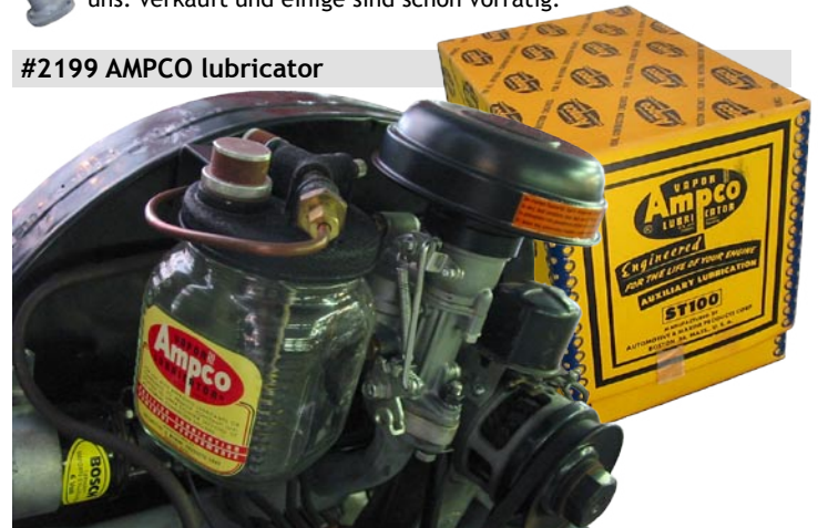
#2199 AMPCO lubricator

Die letzten Jahre ist verbleites Benzin in der Tankstelle nicht länger erhältlich. In '70 Jahre war das schon die Falle in die Vereinigten Staaten und haben sie dort einen Satz entwickelt welcher der Schmierfetteffekt des Benzins auffängt, durch das Öl unter den Vergaser zu benebeln. Das Vorteil dieses Satzes ist nicht nur dass man mit den 25-30 H.S. Motoren ohne Probleme auf verbleitem Benzin fahren kann, aber die Leistung wird auch verbessern, weil die Zylinderköpfe geschmiert werden, wodurch die Ventile, die Ventilefeder, der Kolben und Zylinderwände immer gereinigt und geschmiert werden. Also wird die Lebensdauer des Motors länger und die Leistung des Motor auch verbessert. Der Ölverbrauch wird auch abnehmen. Verkauft der Satz für 1 Motor und Stock ist schon erhältlich.