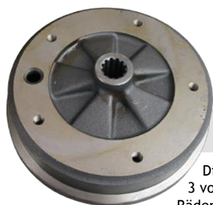
#1282-1 Bremstrommel hinten, Typ 3, '63-'67, 5-Loch

Diese hintere Bremstrommel ist für den Typ 3 von 08/'63 bis 07/'65 und ist für die 5-Loch Räder (5x205). Original werden sie ab Ch. 221 975 bis Ch. 315 215 000 einschließlich verwendet. Sie werden das Stück verkauft und wir haben schon einige im Vorrat.